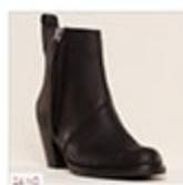
Acne-plaggene vi elsker