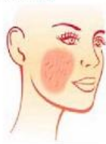
BETENNELSE I HUDEN: Rødhet i ansiktet og sprenge blodkar er typiske symptomer på rosacea.